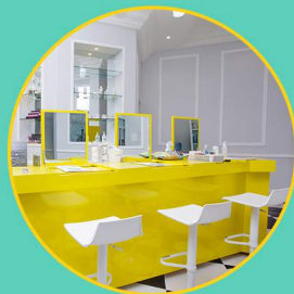
Le Studio BAR