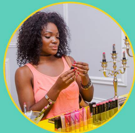
Le BAR du Regard